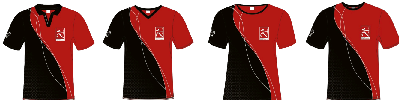
Polo homme et femme